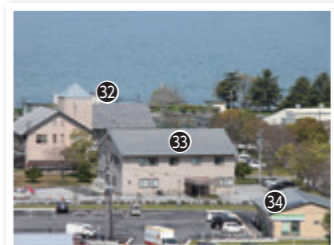
㉗ 湖沼環境実験施設 ㉝ 地域共生センター