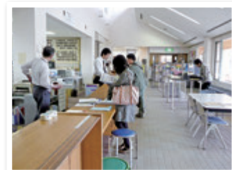
⑯ 大学管理棟 (学生支援センター)