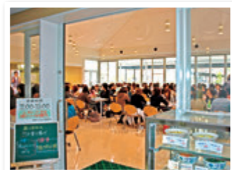
㉚ カフェテリア (ナシェリア)