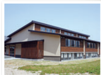
⑳ 共通講義棟 / 同窓会館 (湖風会館)