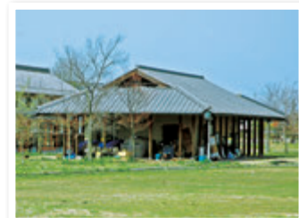
㉖ エコキャンパスセンター・もくれん