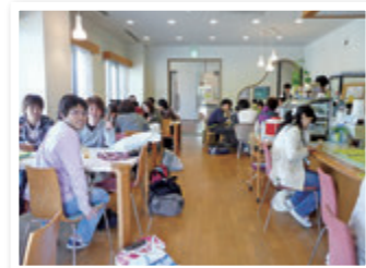
⑪ 喫茶 (ピアノシモ)