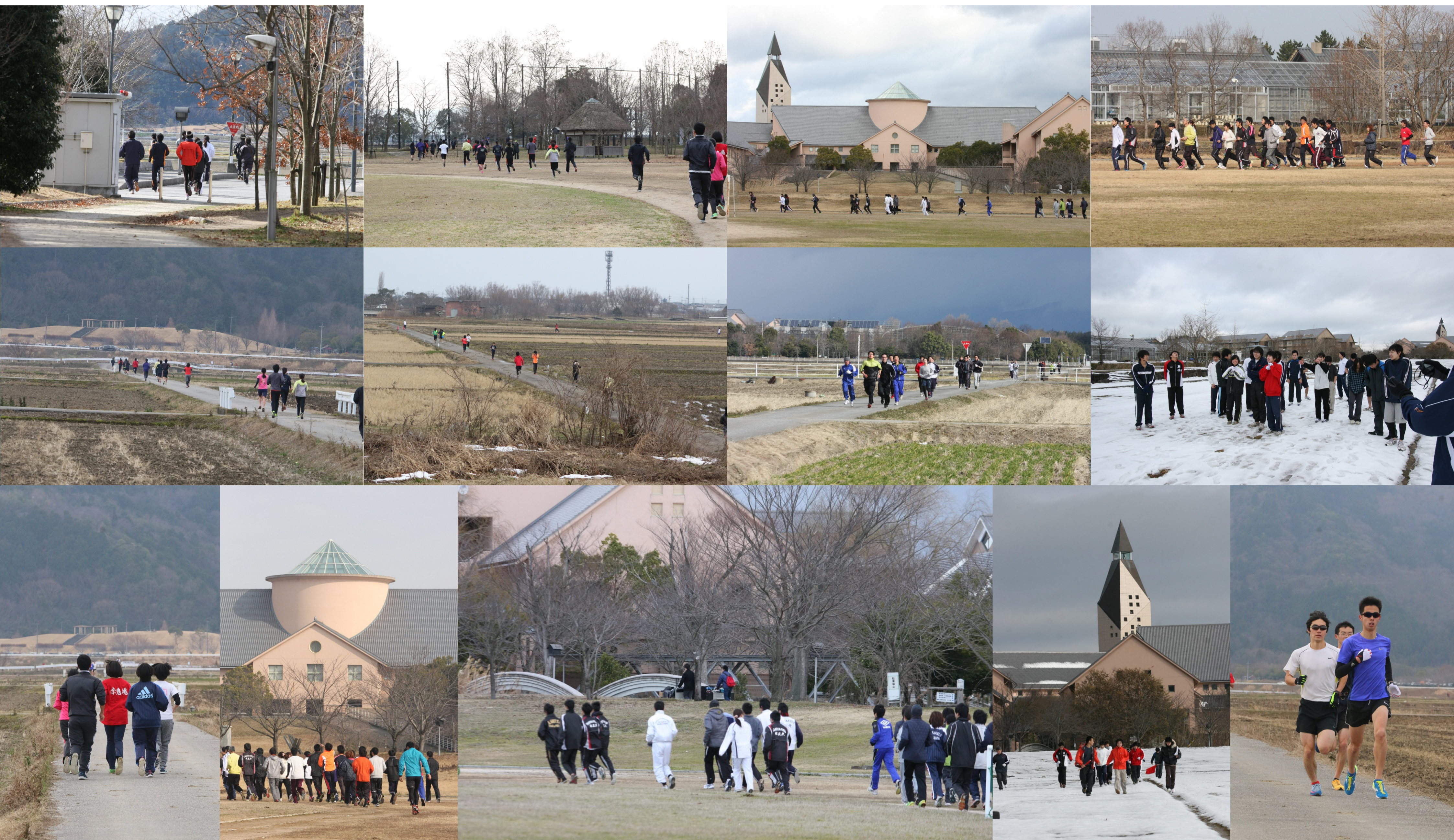
*大会風景の写真は長浜スタジオさんよりご提供いただきました。