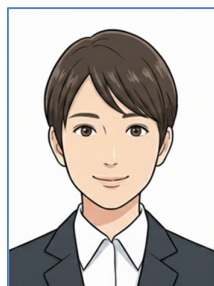
(正しい証明写真の例)