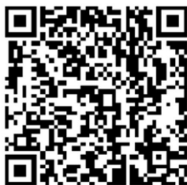
新入生特設サイト QR コード

【新入生特設サイト】 https://www.linc.usp.ac.jp/info_center/info_new%20student.html