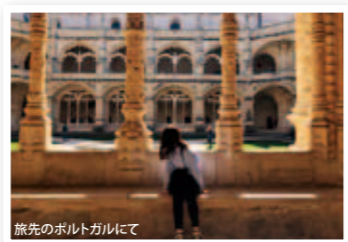
旅先のポルトガルにて