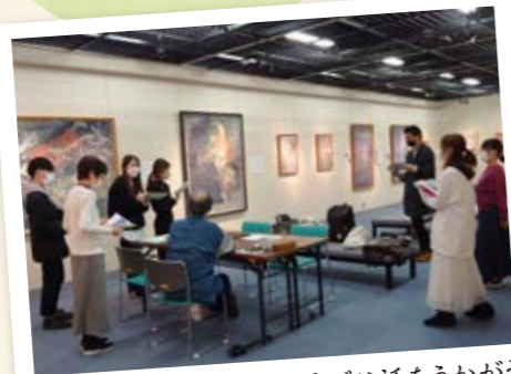
大津の三橋節子美術館でお話をうかがう