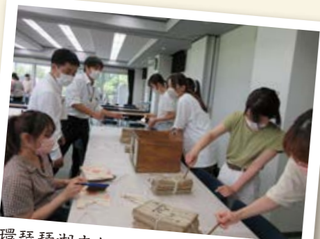
環琵琶湖文化論実習での古文書整理