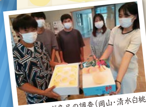
地域ブランド製品の調査(岡山・清水白桃)

人口、産業、都市問題、文化からなる地域の特徴やその背後にある要因を研究した上で、地域の課題を踏まえ、地域づくりに貢献する方法を学びます。