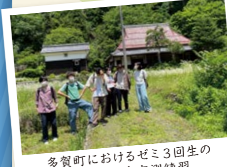
多賀町におけるゼミ3回生の 茅葺き民家実測練習

各地に残された遺跡や歴史的景観、生産・生活用具などの地域遺産を調査記録し、持続可能な状態で後世に残し活用するための方法を学びます。