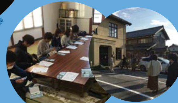
彦根市日夏のフィールドワーク