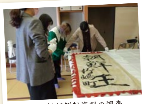
大垣祭朝鮮軸資料の調査