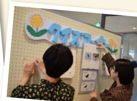
「県大ミニ博物館」の架設風景