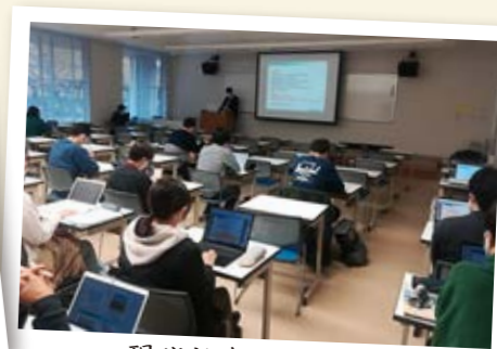
現代社会系合同ゼミ (滋賀県庁職員による出張講義)