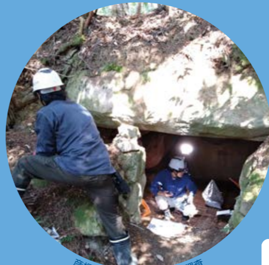
彦根市荒神山古墳群の発掘調査