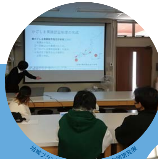
地域ブランド産品（かごしま黒豚）の調査発表