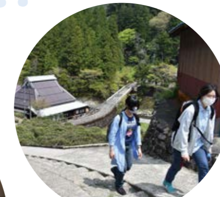
東近江市政所での茶畑の調査