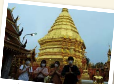
タイのドイステープ寺院にて