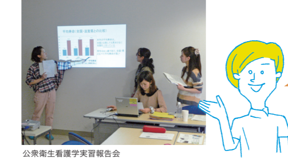
公衆衛生看護学実習報告会

保健師課程は、2年次終了時に希望者の中から30名程度（編入学生含む）が選抜されます。助産師課程は、2016年度入学生から募集を停止し、編入学生のみとなりました。2019年度大学院助産師コース（仮称）開設に向けて準備中です。詳しくは募集要項などにて確認してください。