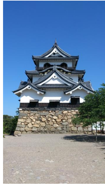
Hikone Castle National Treasure of Japan