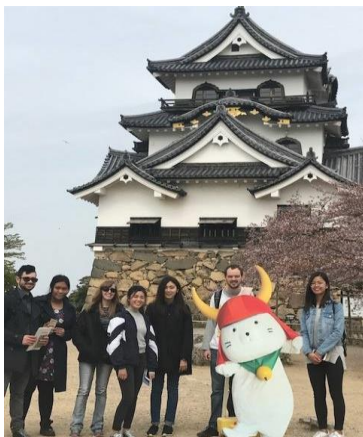
ひこねし ほこ なくほう ひこねじょう 彦根市が誇る国宝・彦根 城