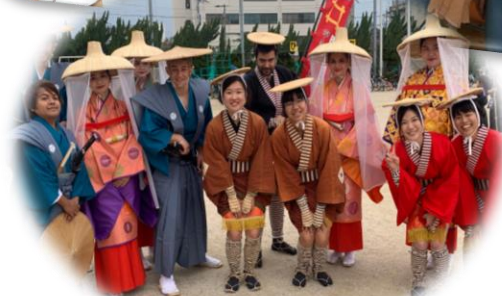
Exchange students of the fall semester, 2019