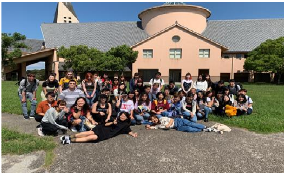
2019年後期の交換留学生