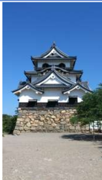
Hikone Castle National Treasure of Japan