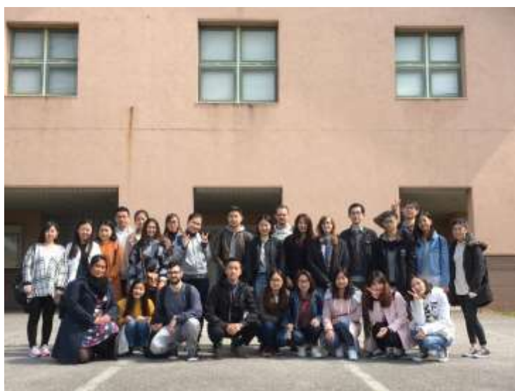
2017年前期の交換留学生 Snapshot of Exchange students in April, 2017