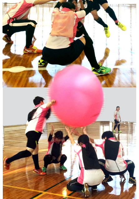
●部員数/40人 ●活動場所/体育館・彦根市立南中学校 ●活動日/木・金・土

キンボールとは4人1チーム×3チームで直径約1.2mのボールをヒットやレシーブをして対戦する屋内スポーツです。桃球の部員のほとんどは大学からキンボールを始めた人ばかりですが、練習はもちろん、いろいろな大会に出場しています。平成26年度のJapanカップの男女別では3位という成績を収めました。キンボールは誰でも楽しめて、とても奥の深いスポーツです。興味があったら気軽に体育館まで見学・体験に来てください!