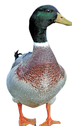
鴨部(鴨あひるの世話) 部員数/25人 活動場所/園場 活動日/毎週1回程度

県立大学は環境系の団体が幅広い活動をしているのも特長の一つです。他にも音楽系、芸術、ボランティア、趣味的なものなど多彩な団体があります。その中にきっと新しい自分を見つけることのできる活動があると思います。気になるクラブ・サークルがあれば、ぜひのぞいてみてくださいね。