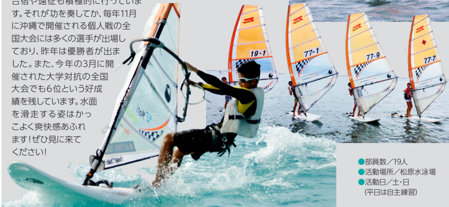
●部員数/19人 ●活動場所/松原水泳場 ●活動日/土・日 (平日は自主練習)

私たち滋賀県立大学ウインドサーフィン部は滋賀大学ウインドサーフィン部と合同で「滋賀ウインドサーフィン部」として活動しています。『全国制覇』という目標を掲げ、目標に向け部員全員で切磋琢磨しています。私たちは松原水泳場で練習しており、大学から自転車まで20分ほどなので、他大学に比べ浜が近く、練習量を多く取れることが強みです。また、冬場の彦根の強風で技術面も精神面もかなり鍛えられているかと思っています…。合宿や遠征も積極的に行っています。それが功を奏してか、毎年11月に沖縄で開催される個人戦の全国大会には多くの選手が出場しており、昨年は優勝者が出ました。また、今年の3月に開催された大学対抗の全国大会でも6位という好成績を残しています。水面を滑走する姿はかっこよく爽快感あふれます!ぜひ見に来てください!