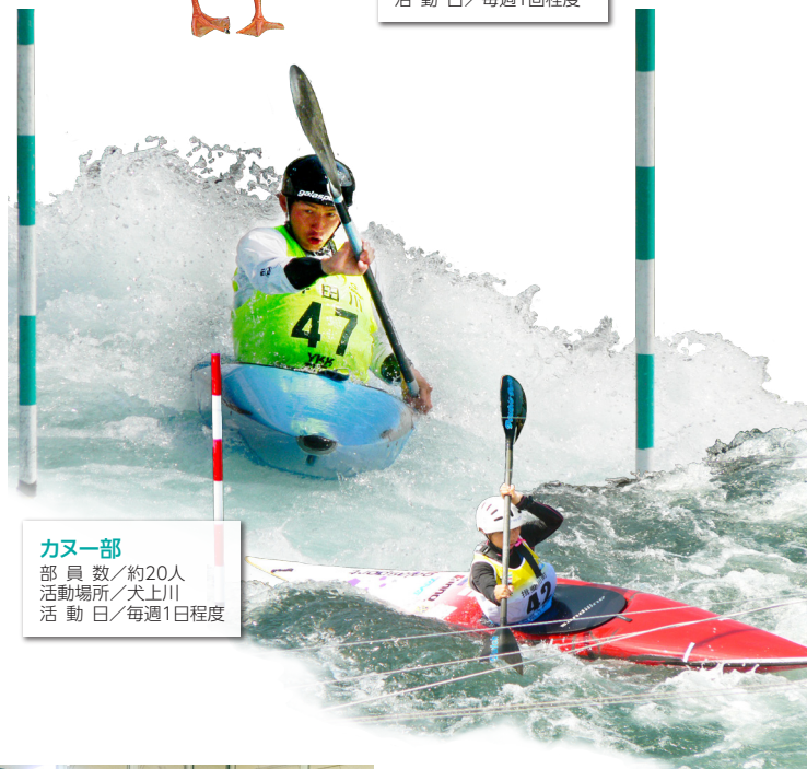
カヌー部 部員数/約20人 活動場所/犬上川 活動日/毎週1回程度