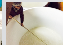
●部員数/20人 ●活動場所/A4棟他 ●活動日/不定期

日本酒プロジェクトでは、喜多酒造と共同で県大オリジナルの日本酒「湖風」を作っています。普段は各部署に分かれて、ポスターなどの宣伝物を作ったり酒粕レシピを考えたりしています。その他、月に一度ほどの割合で、校内や学外の試飲販売などのイベントに参加しています。冬には酒蔵見学に行き、お酒造りの体験をさせてもらいながら日本酒のできるプロセスを学びます。最近では、新聞や雑誌に取り上げてもらう機会も増えてきました。さあ、あなたもぜひ私達と一緒に湖風をプロデュースしましょう!