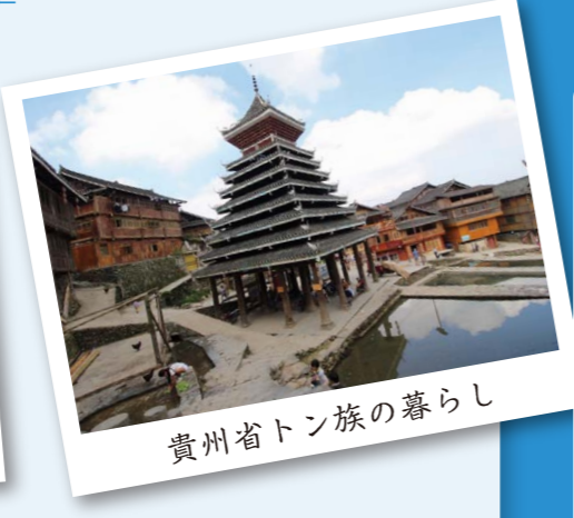
貴州省トン族の暮らし