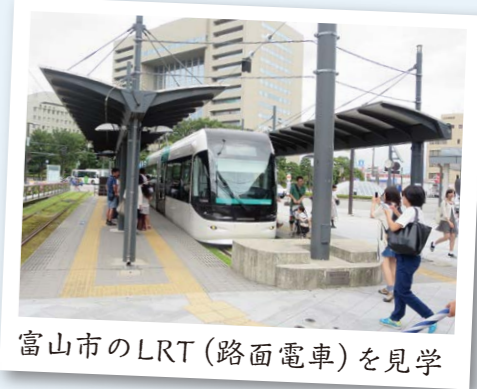
富山市のLRT(路面電車)を見学