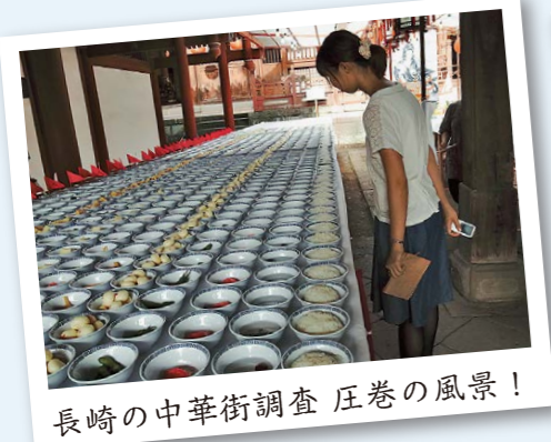
長崎の中華街調査 圧巻の風景！