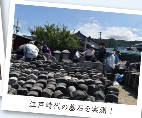
江戸時代の墓石を実測！