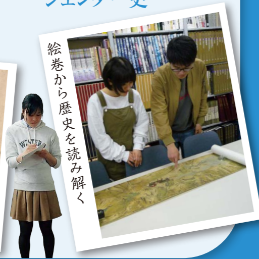
絵巻から歴史を読み解く