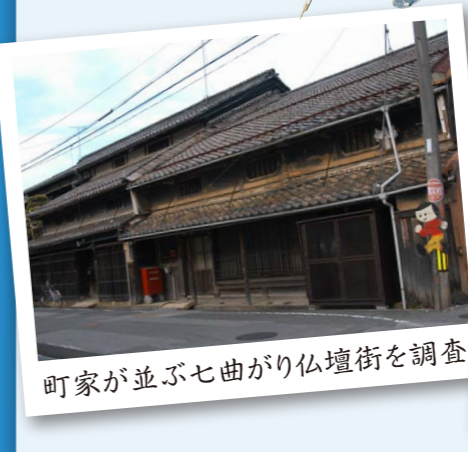
町家が並ぶ七曲がり仏壇街を調査

各地に残された古代の遺跡や歴史的景観、生産・生活用具などの地域遺産を調査記録し、持続可能な状態で後世に残し活用するための方法を学びます。