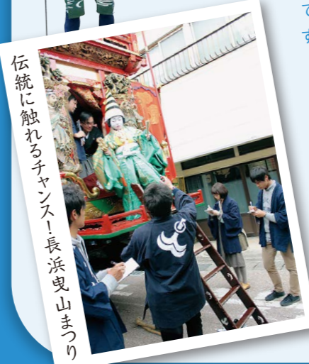
伝統に触れるチャンス！長浜曳山まつり

人口、産業、都市問題、文化からなる地域の特徴やその背後にある要因を研究した上で、地域の課題を踏まえ、地域づくりに貢献する方法を学びます。