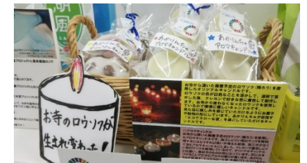
〔 近江楽座関連商品の販売 〕 → （ 上段：政所茶 ） （ 下段：リサイクルキャンドル ）