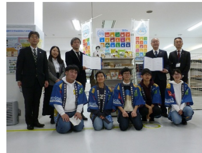
〔 SDG s コーナー 開設式 〕

また、滋賀県立大学生生活協同組合とSDG s の達成に向けた連携推進協定を締結し、学生や教職員のSDG s に関する意識向上などを目的として、大学生協のショップ内に、近江楽座等の学生活動を通じて生産された商品や地産地消・フェアトレードの商品等を販売するSDG s コーナーを設けるなど、SDG s の普及啓発に取り組んだ。