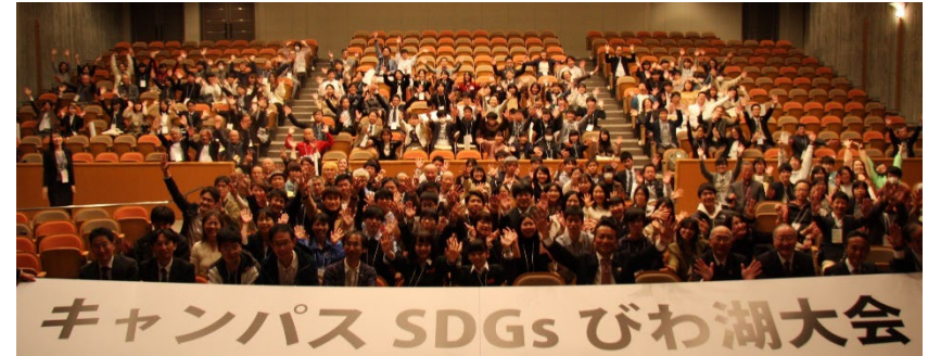
〔 キャンパスSDG s びわ湖大会 〕 （参加者による集合写真）

また、滋賀県立大学生生活協同組合とSDG s の達成に向けた連携推進協定を締結し、学生や教職員のSDG s に関する意識向上などを目的として、大学生協のショップ内に、近江楽座等の学生活動を通じて生産された商品や地産地消・フェアトレードの商品等を販売するSDG s コーナーを設けるなど、SDG s の普及啓発に取り組んだ。