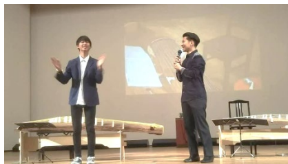
[ 箏曲コンサートの様子 ] （地域デザインD）

また、学生の地元就職率の向上に向け、平成 30 年度に試行を行った「ジョブ交座」の取組を本格化し、全 5 回で 18 の企業・団体が出展、延べ 250 名以上の学生が参加した。これは、昼休みに学生が集まる学生ホールにおいて、本学のOB・OGを含む地元企業の若手社員と気軽に意見交換できる場を設けるもので、学年に関係なく早くから様々な業種の社員と接することにより、県内企業に対する理解の促進を図るだけでなく、学生のキャリア選択の幅を広げることもつながっている。