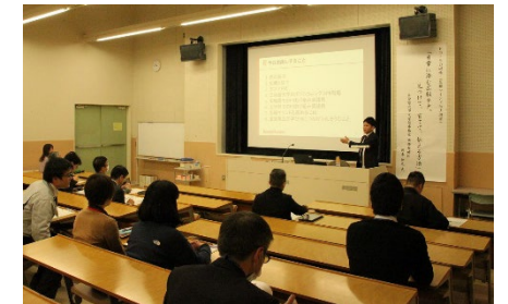
[ 広報マインド向上研修 ]

全学的な広報推進体制の強化に向けては、「日常に潜む広報ネタ。見つけて、育てて、伝える方法」と題した教職員向けの広報マインド向上研修を開催し、他大学での取組事例を交えながら、大学のPR戦略や効果的な発信方法を学ぶ機会としたほか、広報連絡員会議の開催、学内向けの広報ニュースレターの配信などを継続して行い、広報マインドの向上を図った。