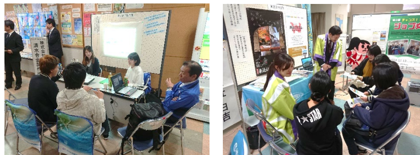
[ ジョブ交座 ]

ップや、地域課題を解決するビジネスプランを表彰する「大学によるアイデアコンテスト」などの取組を継続して実施し、学生の職業意識、起業マインドの向上を図った。