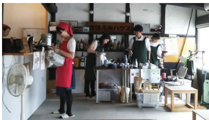
[ コミュニティ・カフェの様子 ] （地域デザインC）

COC+事業の最終年度となる令和元年度は、近江楽士（地域学）副専攻のソーシャル・アントレプレナー（SE）コースにおいて、学生が起業体験を行うプログラムを前年度に引き続き開講し、彦根市内の築 100 年の古民家を活用したコミュニティ・カフェの企画・運営や、滋賀県立文化産業交流会館との連携により、和楽器用生糸の産地である湖北地域において世界的に活躍する箏曲アーティストのコンサート事業の企画・制作を行うなど、教育内容の定着を図った。SEコース修了者は、大学院進学者を除きすべてが県内での就職となり、地元定着につながった。