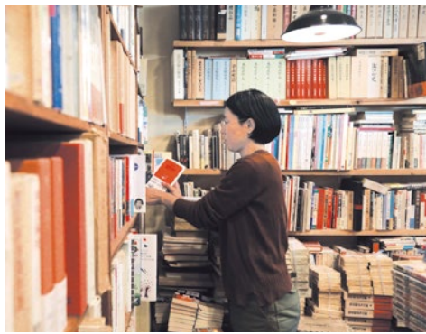
歴史ある街・彦根で 幅広い学びに触れた学生時代

※2008年の環境科学部、人間文化学部の学科再編に伴い、人間関係学科等が設置された。